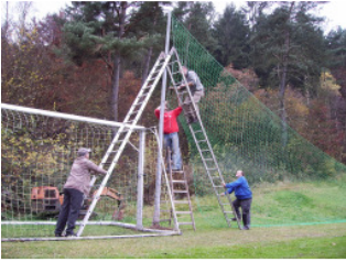
Durch die Ballfangzäune können die Zuschauer nun gefahrlos die Spiele verfolgen..

Ballfangzaun schützt die Kinder beim Spielen. Zudem wurden gegen Ende des Jahres Ballfangzäune hinter beiden Toren aufgestellt.