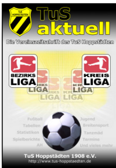
Das aktuelle Cover des TuS Aktuell

das Internet/E-Mail erleichtern die Erstellung der Zeitschrift um einiges. Trotz dieser Technisierung ist die Erstellung der Zeitschrift auf die menschliche und zugleich ehrenamtliche Hilfe angewiesen.