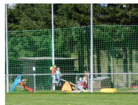
Sehr familienfreundlich: Der Kinderspielplatz bietet auch den Kleinen einen abwechslungsreichen Nachmittag.

1965/1966 den Platz auf die notwendigen Maße auszubauen. In den Jahren 1966/1967 wurde der Sportplatz drainiert und mit einer roten Erde-Decke überzogen. 1971 wurde Trainingsbeleuchtung installiert und unterhalb des Sportplatzes ein großer Parkplatz angelegt, außerdem wurde die Sportanlage an ihrer südlichen Seite mit einem Ballfangzaun begrenzt. 1997 wurde der Hartplatz zu einem Rasenplatz umgebaut. Im Jahre 2007 wurde für die „Kleinen“ ein Spielplatz hergerichtet. Ein