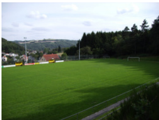
Ein Blick aus zweiter Reihe auf das Sportgelände.

1928 wurden zum ersten Mal Spiele auf der "Schmittwies" ausgetragen. Damals traf der Name des Sportplatzes noch voll zu, denn erst im Jahre 1954 wurde die Sportanlage in Eigenleistung ausgebaut. Da dem Verein damals weder die entsprechenden Baugeräte noch die finanziellen Mittel zur Verfügung standen, wurde der Ausbau zwischendurch wieder eingestellt. Dem Verein gelang es aber